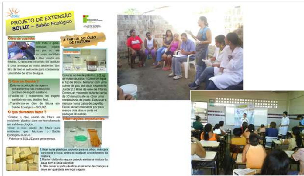
Figura 2: Folder e fotos do Projeto SOLUZ: Educação Ambiental aplicada pelo Projeto SOLUZ.

A pesquisa evidenciou que os participantes da EA perceberam a importância de contribuírem no equilíbrio do meio ambiente, dos entrevistados 63% afirmaram que possuíam interesse em participar do Projeto SOLUZ e 83% acreditam que ações ambientais são de extrema importância para o planeta terra. Apesar de terem essa consciência apenas 12% dos entrevistados realizam práticas voltadas a preservação ambiental.