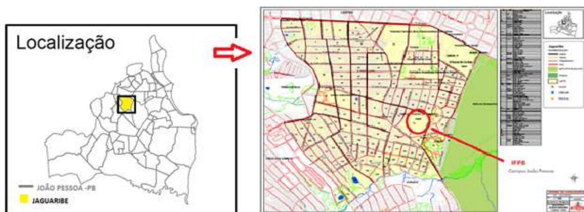
Figura 1: Localização do Bairro de Jaguaribe, João Pessoa - PB.

Em questão as causas ambientais o Projeto SOLUZ, Projeto de Extensão Sabão Ecológico a partir da Reciclagem de óleo usado de frituras em Sabão Caseiro Ecológico – SOLUZ do Instituto Federal de Educação, Ciência e Tecnologia da Paraíba - IFPB, Campus João Pessoa, que trata da reciclagem do óleo de cozinha usado para produção caseira, por intermédio da educação ambiental é divulgado sistematicamente no bairro de Jaguaribe, localizado na cidade de João Pessoa-PB, onde o IFPB está locado.