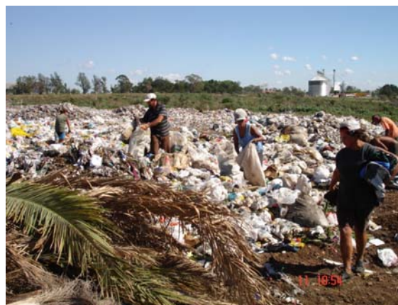
Figura 3. Presença de Catadores no Lixão