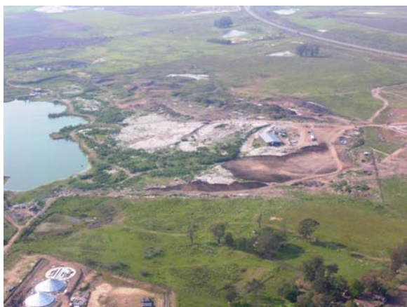
Figura 2. Vista Aérea do Depósito de RSU

Havia presença de catadores na massa do lixo buscando sua subsistência, muitos destes, crianças em idade escolar ou inferior, alguns até “residindo” no local;. A presença de fumaça e fogo, como resultado da combustão espontânea que ocorre na massa de resíduos depositada no solo sem sistema de drenagem para gases. Gases esses gerados pela decomposição da matéria orgânica, bem como a existência de micro e macro vetores, contribuindo para disseminação de doenças e incrementando a poluição. Em cota inferior havia uma lagoa artificial (Figura 2), formada quando da exploração de minerais na área. Tal lagoa possui área 44.442m 2 e estava contaminada por efluentes provenientes da massa de resíduos, denominados lixiviados.