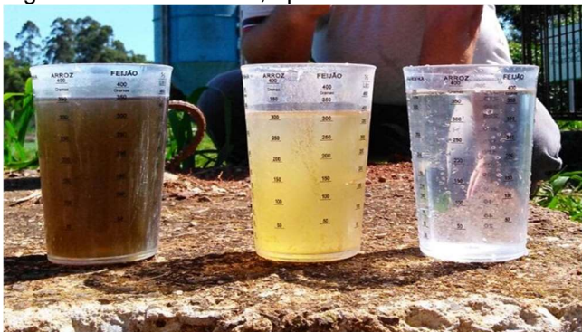
Figura 6 Chorume bruto, após a saída do decantador e efluente tratado.

Dentre as principais limitações que os operadores de uma estação de tratamento de lixiviado de aterro sanitário encontram estão as elevadas concentrações de nitrogênio amoniacal presentes no local. A eficiência global do sistema foi de 77,9% de remoção de N-NH_4^+ e 84% de NTK, com valores médios de 42 mg.L -1 ( N-NH_4^+ ) e 51 mg.L -1 (NTK) ao final do tratamento. Em todas as análises, os resultados apresentaram valores acima do limite máximo estabelecido nas legislações, de 20mg/L. A figura 6 demonstra os aspectos visuais do chorume pré e pós-tratamento: