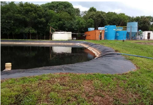
Figura 1 Tanque de equalização. 2018