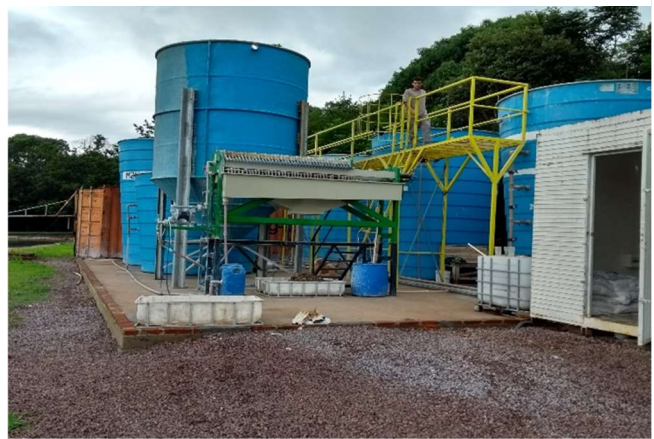
Figura 2 Planta de tratamento de efluentes instalada.